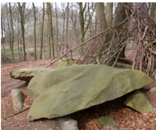
Das Großsteingrab Teufelsbacktrog in Belm-Vehrte.

Weiter geht es in den Wald hinein zum Fundplatz der eisenzeitlichen Schnippenburg . Dass sich hier im Waldstück einer der bedeutendsten, archäologisch erforschten Fundorte Mitteleuropas befinden soll, ist kaum vorstellbar, da heute kaum noch Spuren auf die Schnippenburg hinweisen. Die versteckt gelegene Ringwallanlage war Handelsplatz und Kultstätte zugleich – ein Zentralort, 250 Jahre vor Beginn unserer Zeitrechnung. Vieles deutet darauf hin, dass die Schnippenburg als Ort für religiöse Rituale genutzt wurde. Bei den Ausgrabungen entdeckte man zahlreiche Opfergruben. Seit 2010 werden Forschungsergebnisse und Funde im Schnippenburgmuseum in Schwagstorf präsentiert.