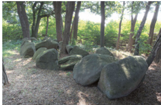
Auf dem Weg zum Eisenzeithaus liegen die Darpvenner Steine.