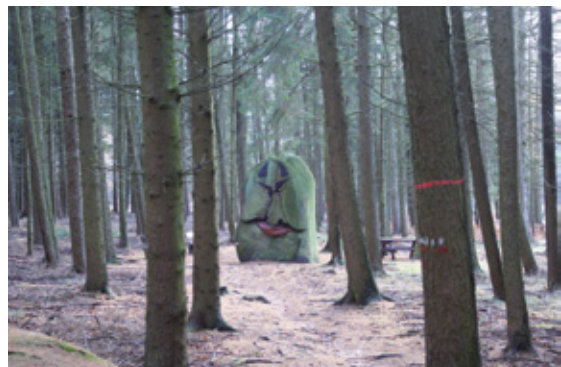
Der Süntelstein in Vehrte wurde vor einigen Jahren nachträglich bemalt.