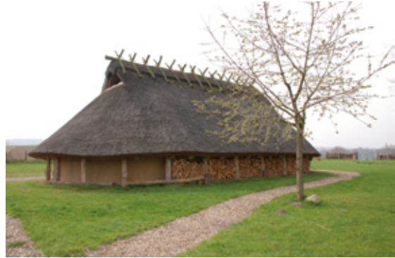
Das Eisenzeithaus in Ostercappeln-Venne.

Von Darpvenne aus verläuft der Weg wieder in den Wald hinein zurück zu den Teufelssteinen in Vehrte. Dazu zählen, neben den Großsteingräbern Teufelsbackofen und Teufelsbacktrog, auch der Süntelstein . Bereits im frühen 19. Jahrhundert war dieser eine rätselhafte Sehenswürdigkeit. Verschiedene Theorien deuten ihn als Denkmal, astronomisches Wahrzeichen, Versammlungsort oder auch kultischen Opferplatz, wie sie sich seit der Jungsteinzeit vor über 5.000 Jahren erhalten haben. Der Sage nach entstanden die Risse im Stein durch die eiserne Ketten des Teufels. Dieser schleppte den Süntelstein auf seinem Rücken, um den Eingang der Venner Kirche zu versperren. Der Versuch aber misslang und der Teufel verschwand aus der Region. Vom Süntelstein führt der ausgeschilderte Wanderweg zurück zum Naturfreundehaus.