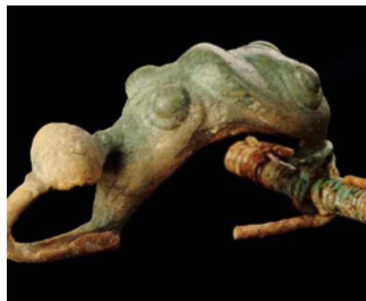
Bei den Ausgrabungen an der Schnippenburg fand man eine Gewandschließe (Fibel) aus Bronze, 3. Jdh. v. Chr.